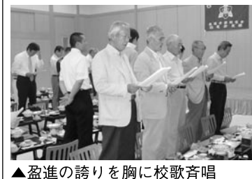
▲盈進の誇りを胸に校歌斉唱

減ってきた・・・」と、欠席される人が多いのですが、ある先輩が、「同じ盈進いう共通点があるんじゃないか、出席して楽しんでいこうよ」といって、日東会に参加してください。個人を大切に、また「盈進」の心を大切に日東会に参加してください。年に一回出席すれば若返り、力が湧いてきます。世代を超えて付き合う機会が少なくなった近頃、同窓会を大切に